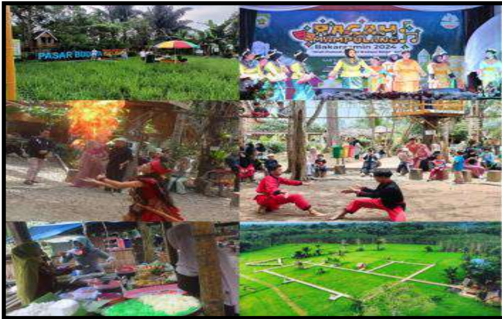
Gambar 7.6 Objek Wisata Racah Mampulang di desa Balida