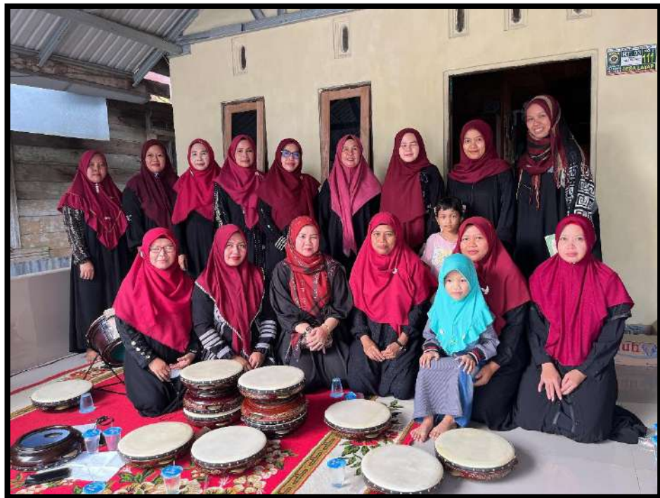
Gambar 5.3 Habsyi Desa Layap Kesenian di Kecamatan Paringin