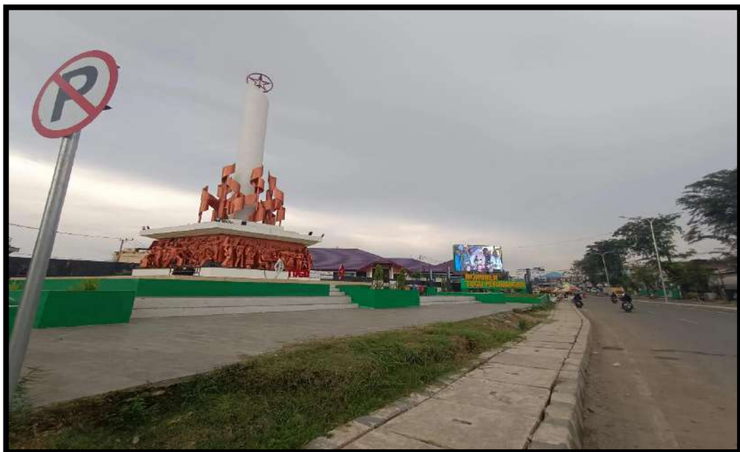
Gambar 7.2 Taman Monumen Tugu Perjuangan