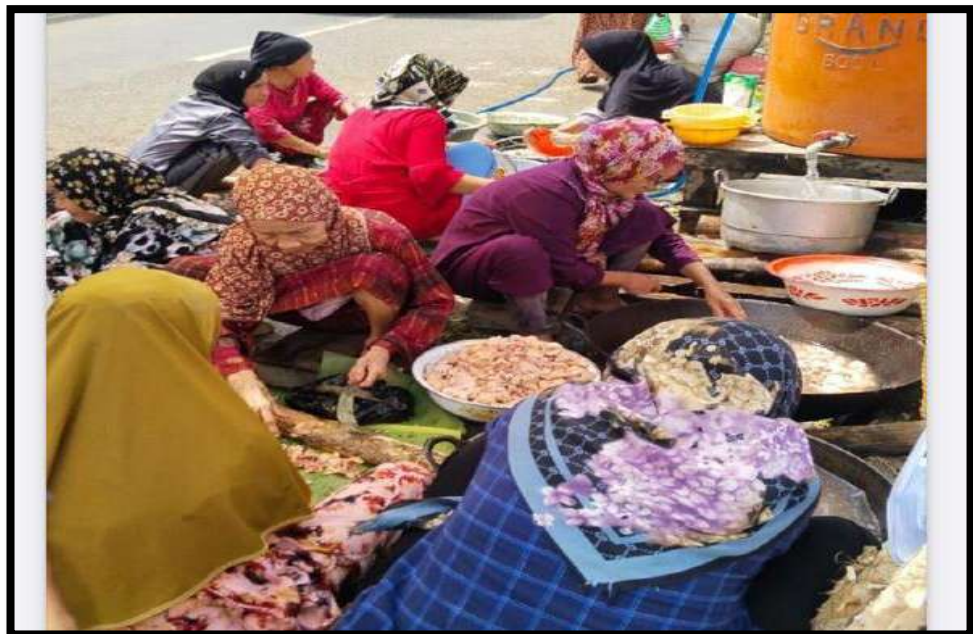
Gambar 5.2 Budaya di Kecamatan Paringin di Desa Mangkayahu Gotong Royong Acara Perkawinan