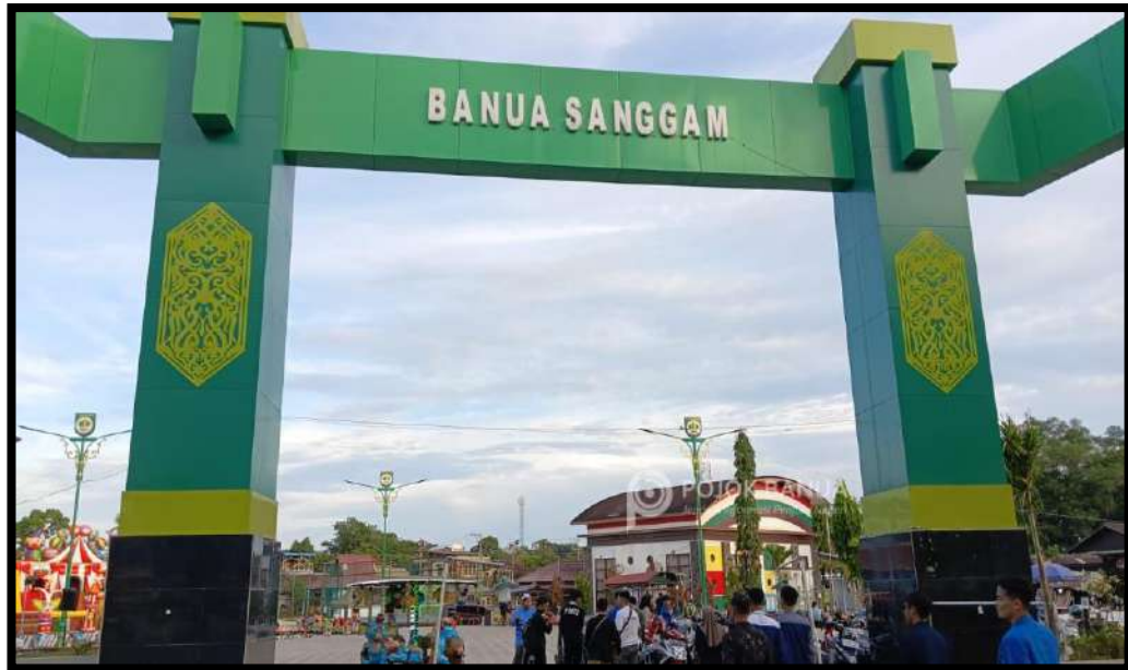
Gambar 7.1 Taman Banua Sanggam

Balang, Kecamatan Paringin, Kabupaten Balangan, Kalimantan Selatan, yang bertujuan untuk mengembangkan potensi desa dan UMKM.