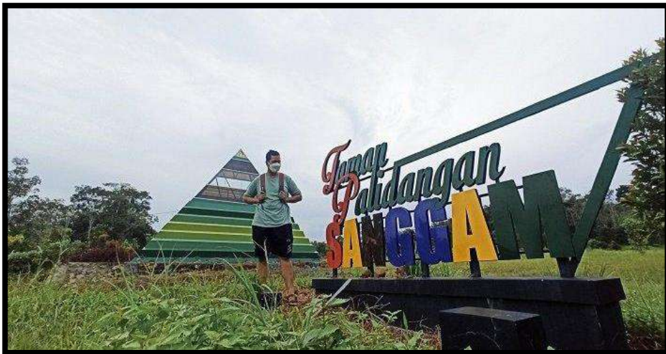
Gambar 7.4 Taman Palidangan Sanggam