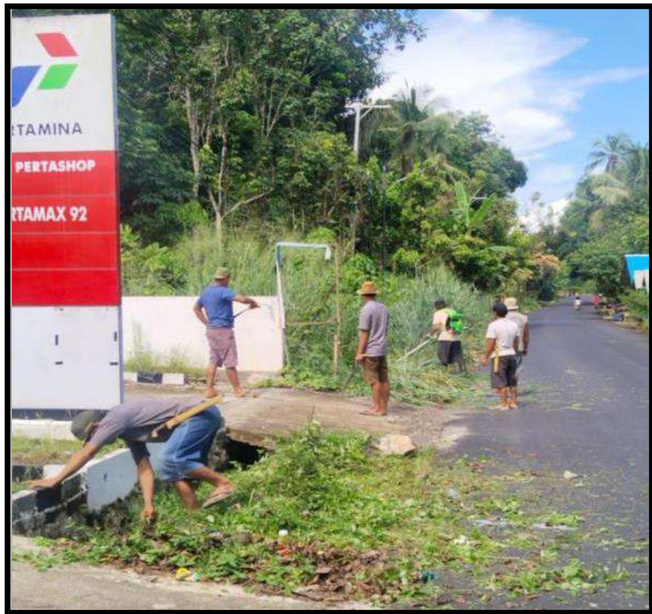
Gambar 5.1 Budaya Kecamatan Paringin di Desa Mangkayahu Gotong Royong Kebersihan