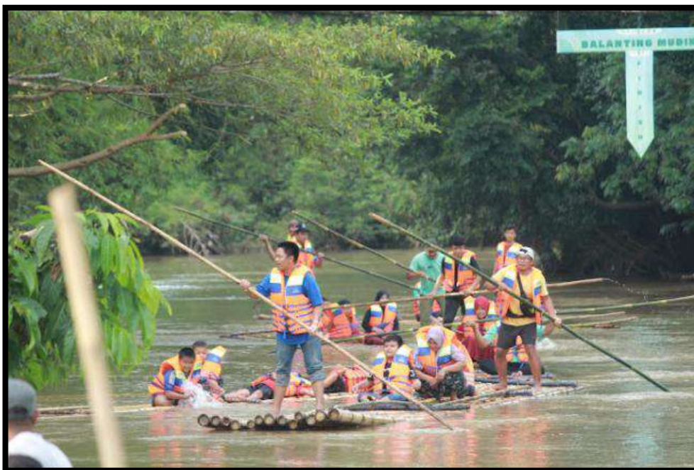
Gambar 7.7 Event Balang Bekayuh di desa Balang