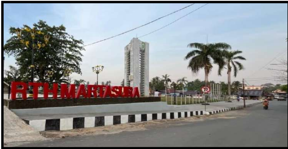
Gambar 7.3 Taman RTH Martasura