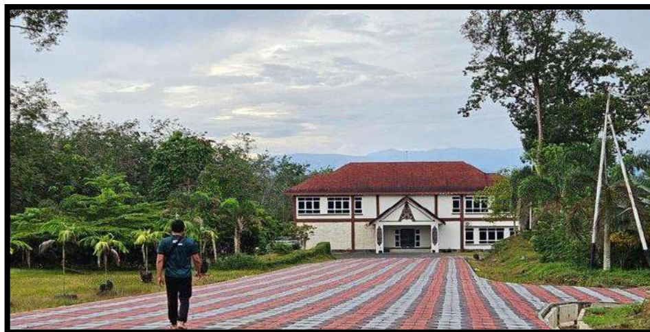
Gambar 7.5 Kebun Raya Balangan