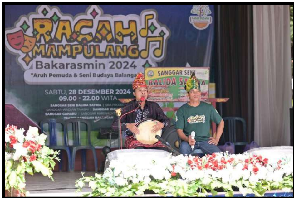
Gambar 5.4 Madihin Desa Balida Kesenian di Kecamatan Paringin